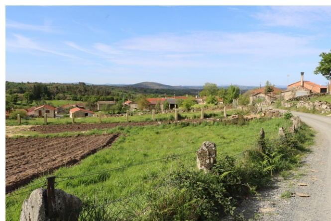
Monte, nas abas do Farelo