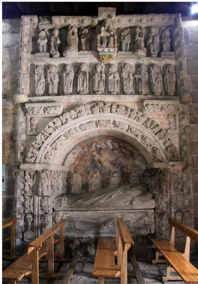
Detalle do interior da igrexa da Ventosa (Agolada)

Despois os eucaliptos, que cada vez chegan máis arriba, fan desaparecer o mato e a vexetación de monte, e deixamos de camiñar por espazos abertos para facelo entre plantacións ata que chegamos á estrada que vai de Borraxeiros ao Castro de Amarante, onde damos por rematada a andaina. O río Ulla, que sería o punto final e límite natural da serra, aínda está lonxe uns 3 km.