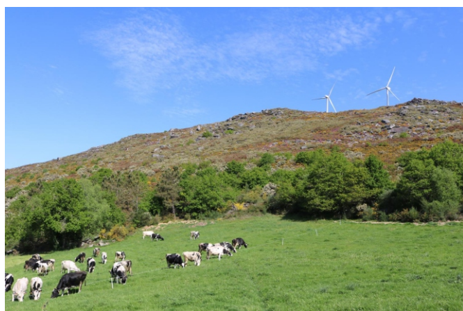
Gando e vexetación autóctona nas abas da serra