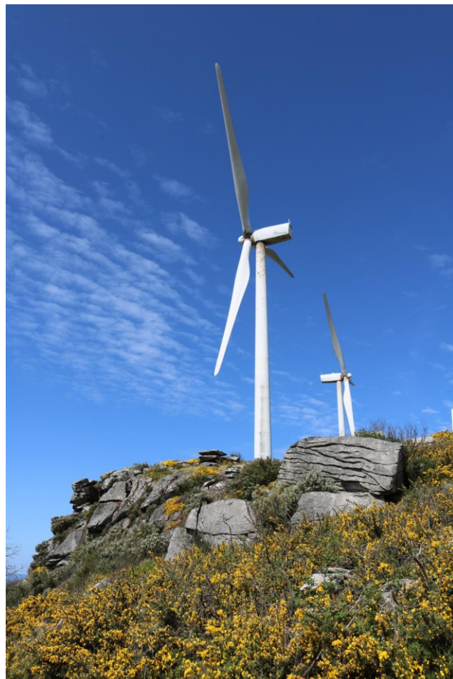
Cume do Farelo

Unha camiñada por unha das serras da Dorsal Galega, a que fai linde natural entre os concellos de Agolada (Pontevedra) e Antas de Ulla (Lugo), para gozar da paisaxe, das panorámicas -da Ulloa, ao leste, do Deza, ao oeste, e, ao norte, ata a Terra de Melide-.