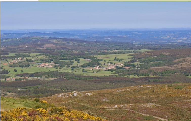
Desde os cumes do Farelo hai unhas boas vistas sobre as serras limítrofes e as comarcas do Deza e A Ulloa.