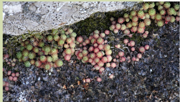
Uvas de lagarto ( Sedum ), pequenas plantas de follas carnosas que se instalan sobre as rochas aproveitando o pouco solo que forman os brións e líques ao descompolas.