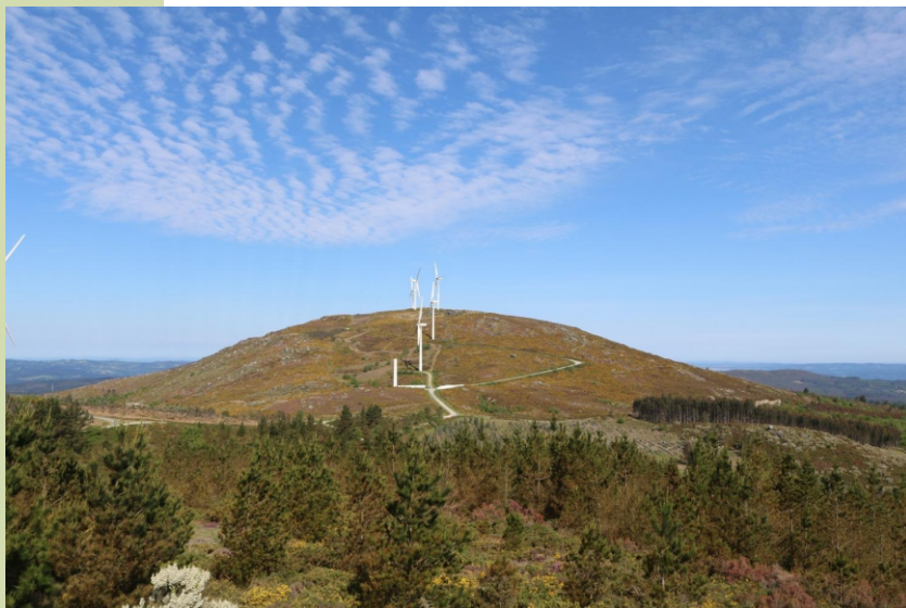
Vista sur do Farelo

Na vertente leste nacen varias cabeceiras do Ulla.