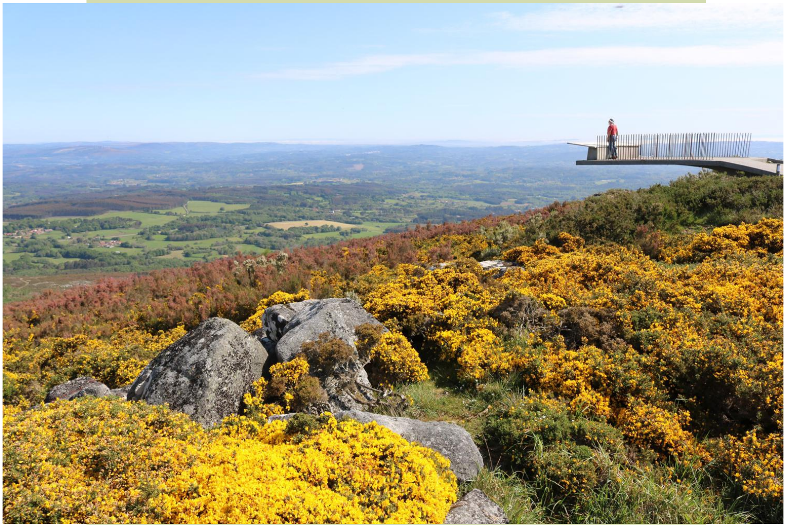
Miradoiro no alto do Farelo. Panorámica da Ulloa.