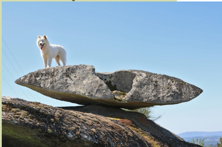
Pena en equilibrio no Pico Longo