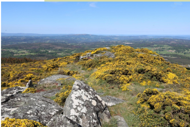
Cume do Farelo