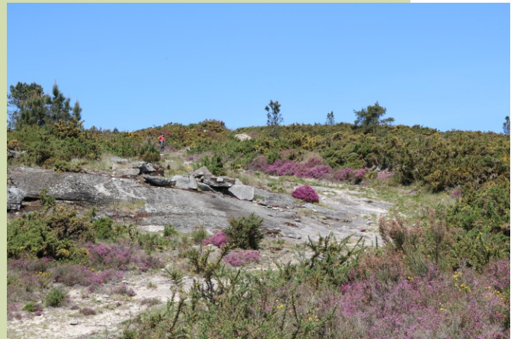
Vista desde o Pico Longo